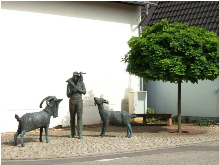
Ziegenplatz Gemeinde Bornheim (2017)