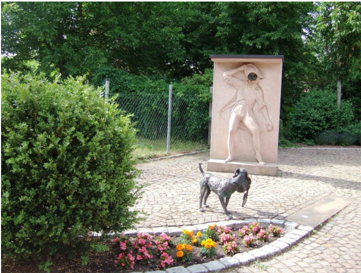
Kunstwerk Harlekin mit Hund in Bornheim (2017)