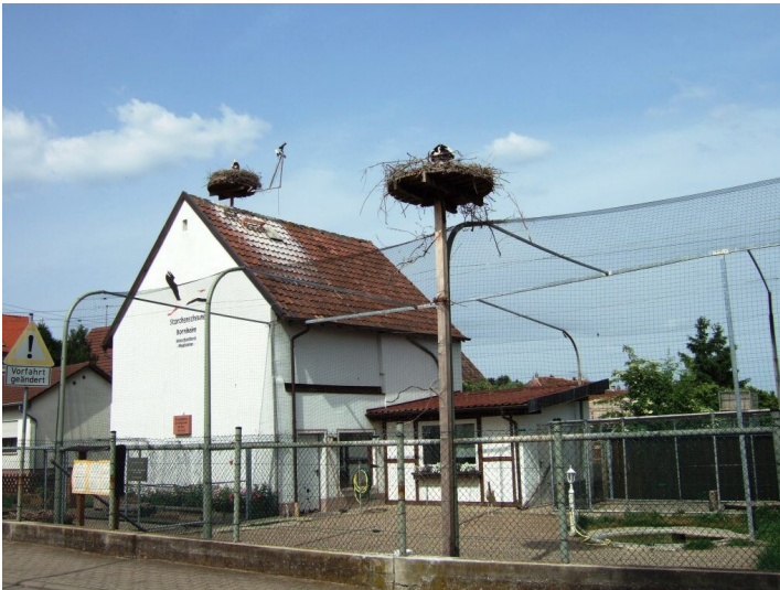
Storchenscheune der Gemeinde Bornheim (2017)