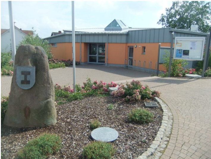
Dorfgemeinschaftshaus in Bornheim (2017)