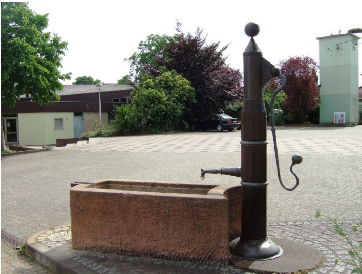
Dorfbrunnen in Bornheim (2017)