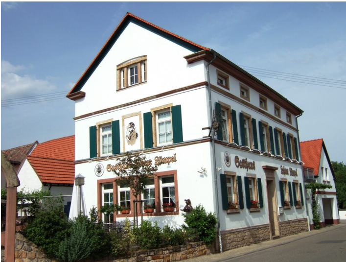
Gasthaus Lehrer Lämpel in Bornheim (2017)