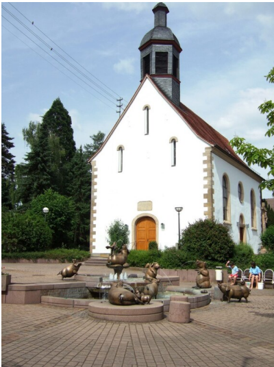
Katholische Kirche Sankt Laurentius in Bornheim (2024)