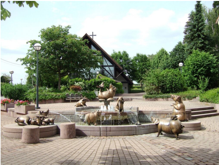
Saubrunnen in Bornheim (2024)