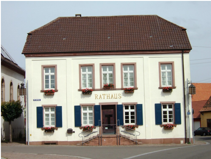
Rathaus Gemeinde Bornheim (2024)