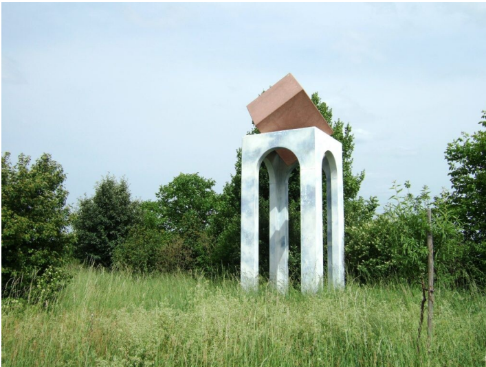
Kunstwerk Himmel und Erde in Bornheim (2024)