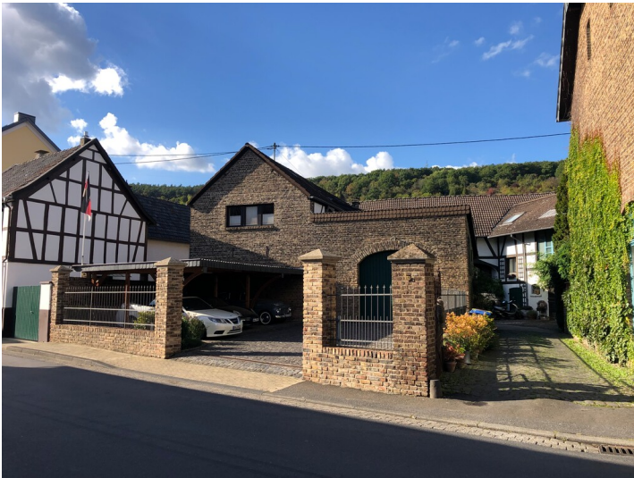
Gebäude nordwestlich der Kirche in Sinzig-Westum (2022)