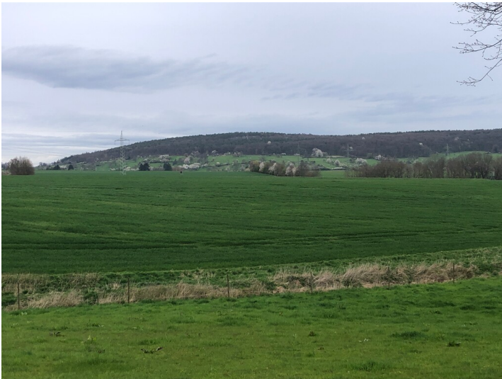
Wüstung Krechelheim (2024)