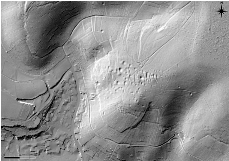
Digitales Geländemodell mit sichtbarem Pingenfeld nordöstlich des Ortskerns von Bad Bodendorf