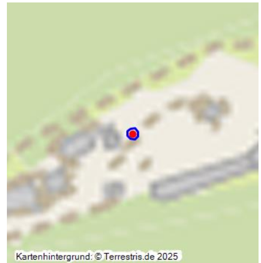
Kartenhintergrund: © Terrestris.de 2025