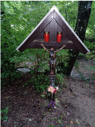
Wegekreuz auf dem Weg zur Lukasmühle Hürtgenwald (2023)