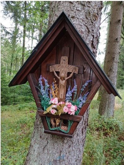
Pilgerkreuz der Heimbachpilger am Buhlert