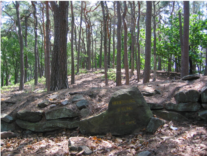
Ritterstein Heidenburg 9. - 10. Jhd. (2011)