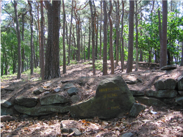
Ritterstein Heidenburg 9. - 10. Jhd. (2011)