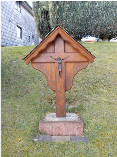
Wegekreuz "Berje Leo" in Nideggen-Schmidt