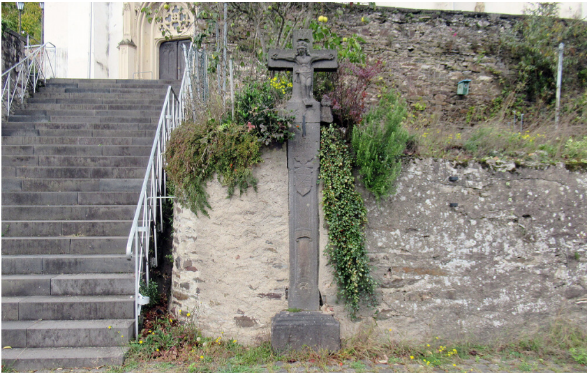
Wegkreuz vor der Kirche St. Maximin in Klotten (2023)