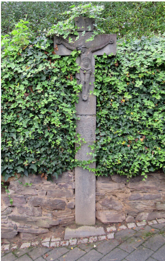
Wegkreuz von 1809 in Klotten (2023)