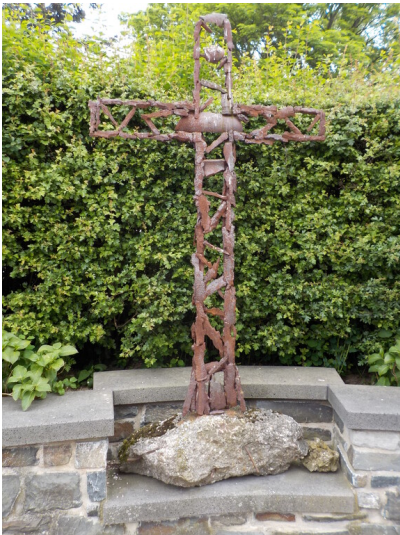
Splitterkreuz in Nideggen-Schmidt