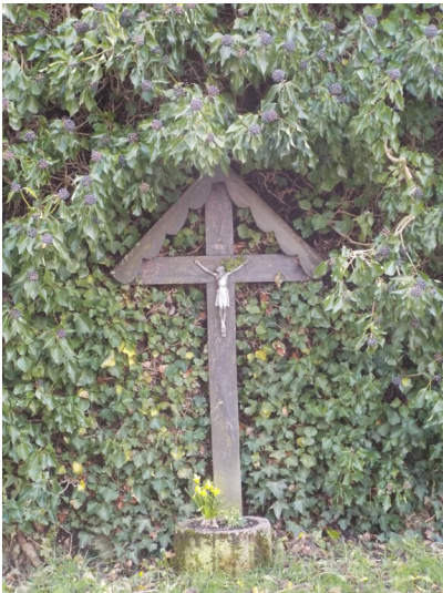
Wegekreuz „op deh Hurth“ in Nideggen-Schmidt (2015)