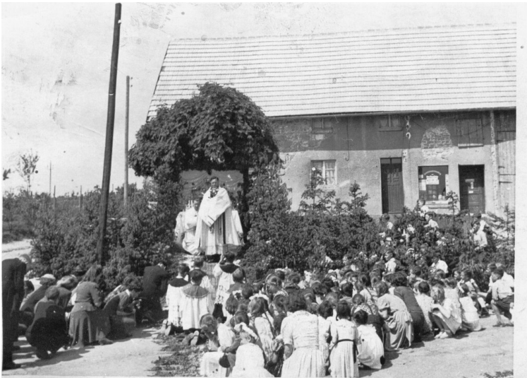
Fronleichnamszug in Schmidt beim „Jiele Krözje“