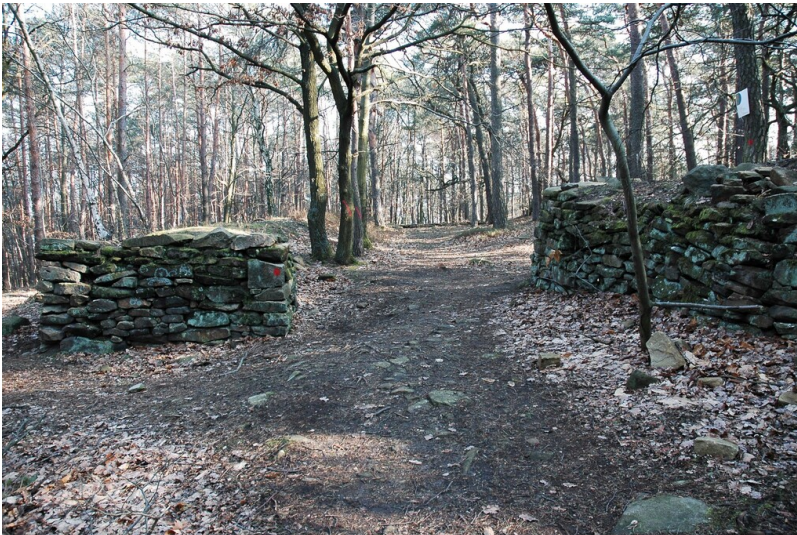
Heidenlöcher bei Deidesheim (2007)