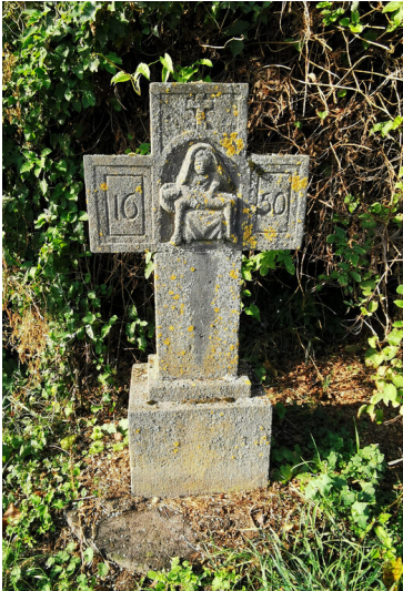
Wegekreuz zwischen Thür und Kottenheim (2025)