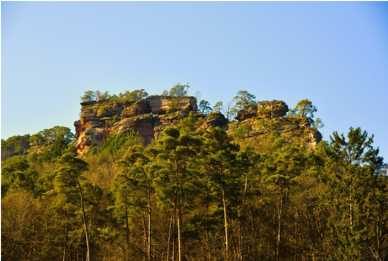
Burgfelsen Hauenstein (2024)