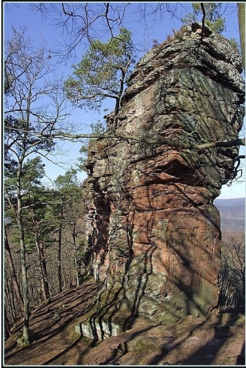
Burgfels von Süden