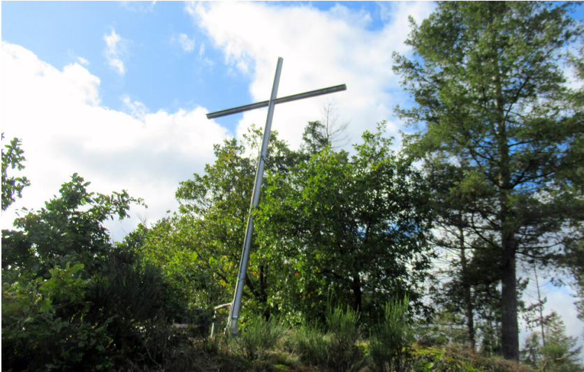
Friedenskreuz bei Klotten (2023)