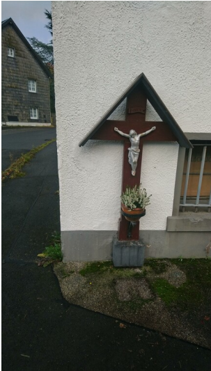
Wegekreuz in Wolfert am Wolfarter Weg (2025)