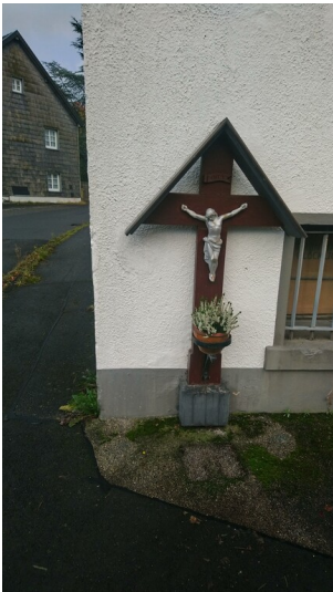
Wegekreuz in Wolfert am Wolferter Weg (2025)