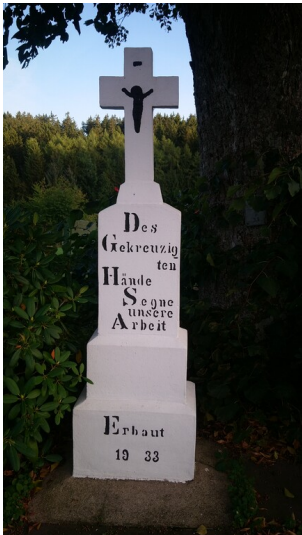
Wegekreuz aus 1933 in Oberdalmerscheid (2025)