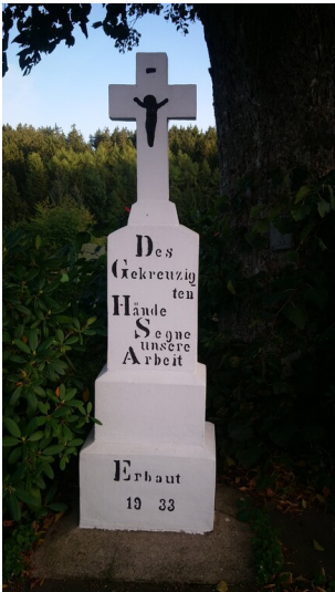
Wegekreuz aus 1933 in Oberdalmscheid (2025)