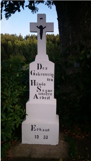
Wegekreuz aus 1933 in Oberdalmerscheid (2025)