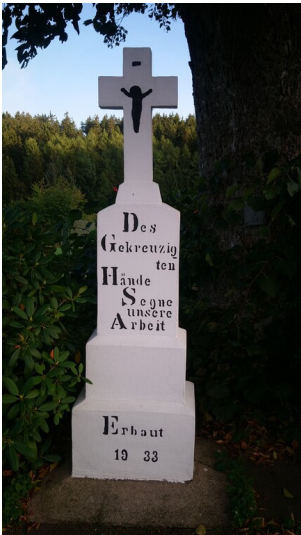
Wegekreuz aus 1933 in Oberdalmercheid (2025)