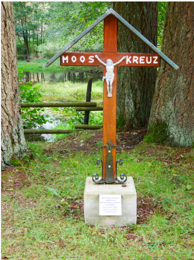
Wegekreuz "Mooskreuz" im Dahlemer Wald (2023)