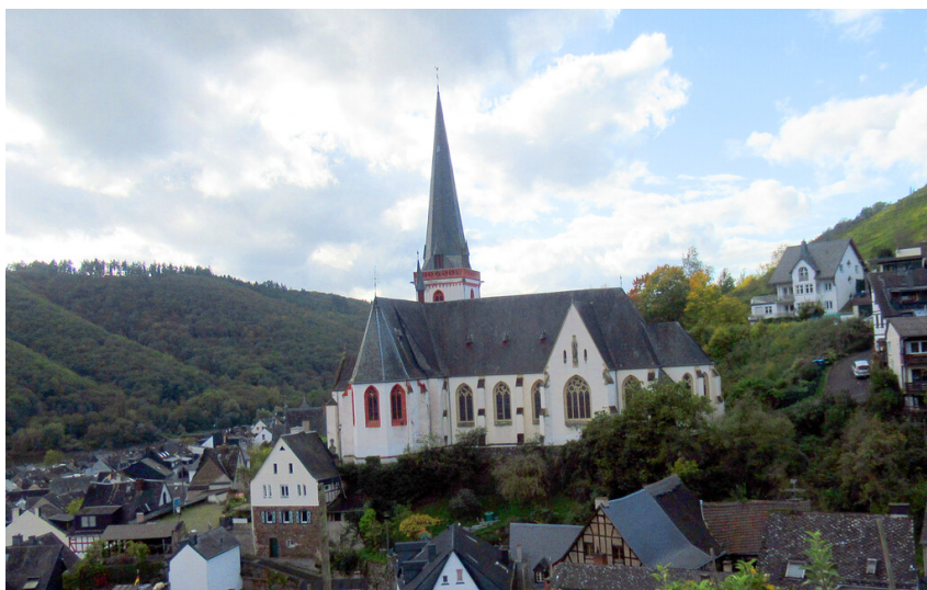
Katholische Pfarrkirche Sankt Maximin in Klotten (2023)