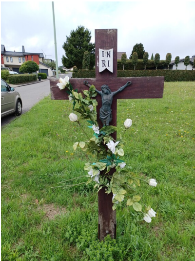
Wegekreuz "Decks Jaous" in Schmidt (2023)