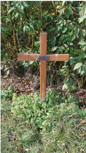
Gedenkkreuz in Hohenfried bei Schleiden (2025)