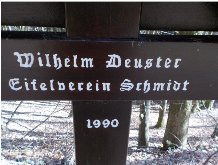
Aufschrift auf dem Wegekreuz zum Gedenken an Wilhelm Deuster