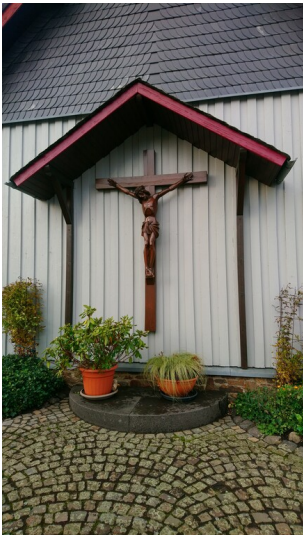
Wegekreuz mit Christuskorpus bei Bornsfeld-Schleiden (2023)