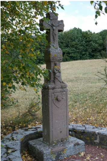
Schaftkreuz mit Relieffigur des hl. Matthias bei Wawern (2023)