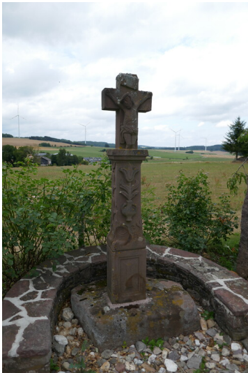
Spätbarockes Schaftkreuz/Wegekreuz aus Sandstein bei Wawern (2023)