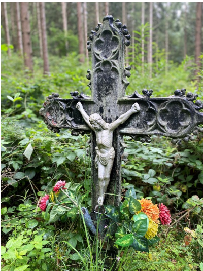
Eisernes Wegekreuz mit Christuskorpus bei Gerolstein-Gönnersdorf (2023)