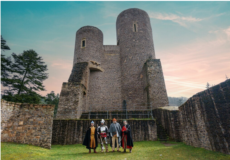
Reenactment an der Frauenburg bei Frauenberg im Landkreis Birkenfeld (2023)