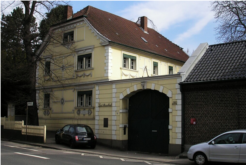
Gebäude des früheren Hofguts Maarhof an der Frankfurter Strasse in Köln-Urbach (2010).