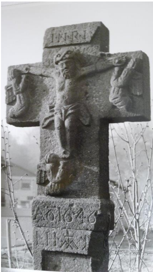
Basaltlava-Kreuz von 1646 in Königsfeld (2025)