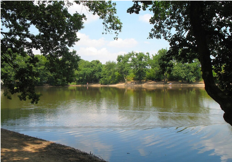
Der untere Scheuerteich in Köln-Grengel (2006), einst Mühlenteich der 1949 abgerissenen Scheuermühle im benachbarten Köln-Wahnheide.