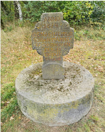
Wegekreuz bei den Grubenfeldern in Mayen (2025)