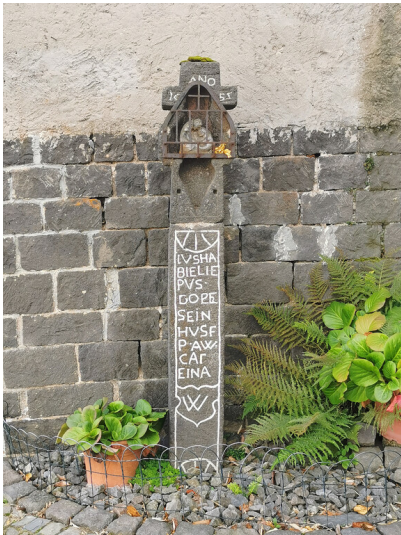
Wegekreuz in Mayen-Hausen an Hauswand in Brunnenstraße (2024)