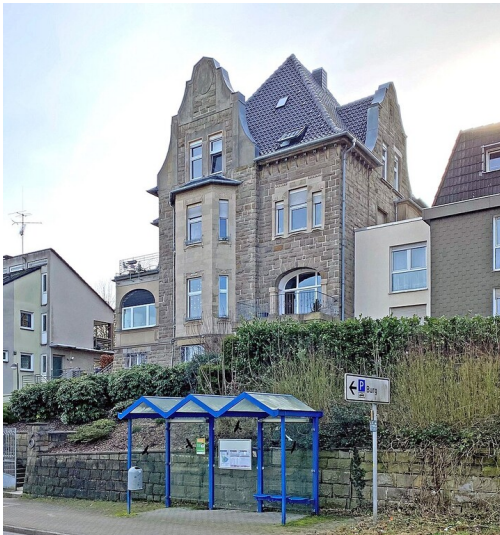
Die Villa Puth in Hattingen-Blankenstein (2022).