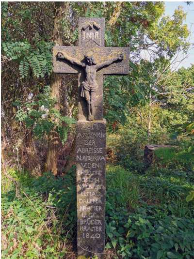
Wegekreuz in Kruft beim Korretsberg.